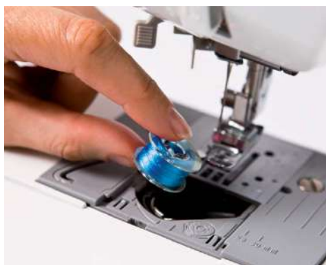
Mise en place rapide de la canette - placez tout simplement une canette pleine et vous pouvez commencer à coudre