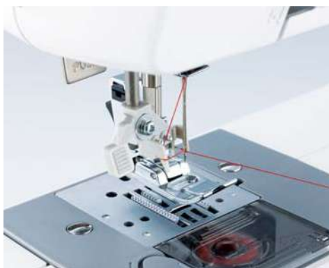
Enfilage facile et automatique de l'aiguille