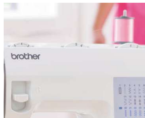
Longueur et largeur de point réglables

Pour plus d'informations, contactez votre spécialiste ou rendez-vous sur www.brothersewing.eu .