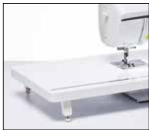
Table d'extension extra-large

Agrandissez votre plan de travail avec cette table d'extension extra-large. Idéale pour les ouvrages de quilting et de couture de grande taille. La table dispose d'une règle et d'un espace de rangement pour votre genouillère.