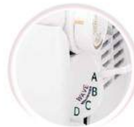
Présélection de couture