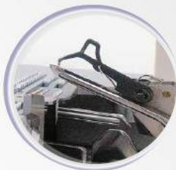
Boucleur surdimensionné avec boucleur auxiliaire intégré