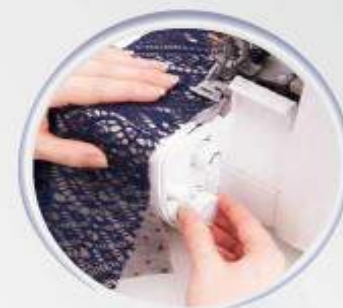
Ergonomie parfaite des boutons de réglage