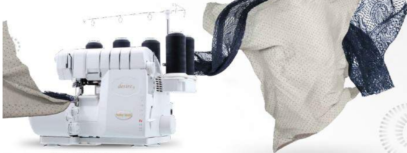
Système ATD baby lock breveté

Résultat de couture optimal pour tous types de tissus