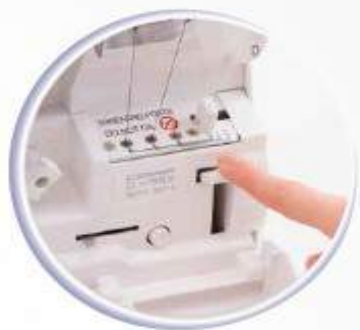
Jet-Air Threading™ System Développé par baby lock en 1993