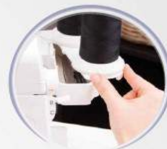
Compartment pour accessoires intégré